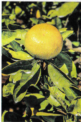
近所の樹にあった枝（青島）。果実が上を向いていて、肌のキメも粗い。お尻部分が日焼けしている

垂れ枝には養分がゆつくりと流れるからか、扁平で肌のキメが細かい小玉サイズのおいしいミカンがなるのだ。果実は葉っぱの陰に隠れて、日焼け果にもなりにくい。樹を一見すると、あまり実がついていないのかな？と思えてしまうが、葉陰に隠れてミカンがぶらさがっている。樹冠の内側にもしっかりとつくる「のだ」。 一方、周囲の園地のミカンの樹を見てみると、果実のお尻が上を向いて光をぞんぶんに浴びている。立ち枝に実がなっているので、養分が勢いよく引